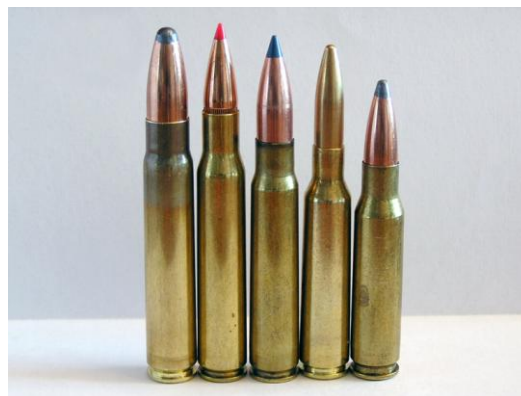
9.3X62, 30.06, 8X57 IS, 6.5X55, et .308 W.

Alors si le 30.06 ne figure pas dans votre arsenal, n'en faites pas un complexe, au contraire.