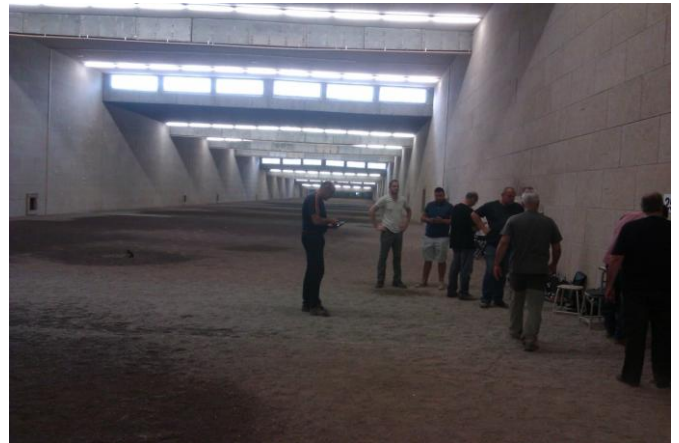
Stand de tir du 21 e RIMa

Le but est que tous arrivent à une manipulation sécurisée de l'arme, un maniement plus fluide de celle-ci, et une bonne adresse au tir, attestée par un score de 25/25 au tir à 30 mètres sur cible fixe. Ainsi, les 3 objectifs essentiels de la formation : sécurité, efficacité, et respect de l'animal chassé seront atteints.