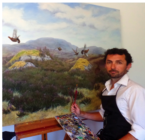
Grouses en Ecosse - Huile sur toile 200 x 115,

Les grands espaces vierges, les paysages majestueux et la faune sauvage, m'ont immédiatement fascinés. Je me présente comme un contemplatif qui aime à restituer sur le papier ou sur la toile ce qu'il voit et ressent dans la nature. Le besoin de prolonger et partager les moments vécus sur le terrain, combiné à un goût prononcé pour l'art, m'ont poussé à devenir artiste.