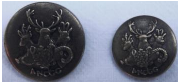
Boutons 3 euros ou 2 euros