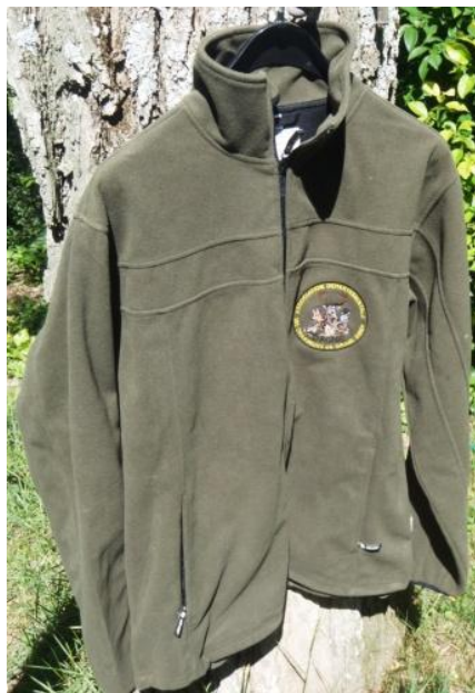
Veste Etanche et Thermorespirante avec logo ADCGG26 59euros

D'autres objets sont aussi à la vente : tee shirt, pull-overs, couteaux....etc