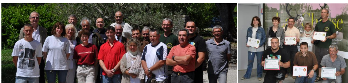
Quelques photos de cet évènement avec les animateurs.