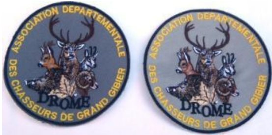
Ecussons fond clair ou foncé : 10 euros