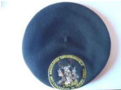
Béret Noir ou Rouge pur laine avec écusson : 16 euros