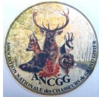
Autocollant intérieur ou Extérieur 2 euros