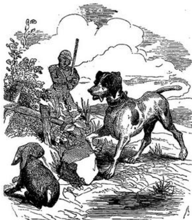
LE CHIEN ET LE LAPIN (Napoléon Bonaparte). Que votre illustre seigneurie Veuille me pardonner, puisqu'il me faut mourir, Si j'ose tenter de m'enfuir.

Aide-toi, le ciel t'aidera. J'approuve fort cette morale-là.