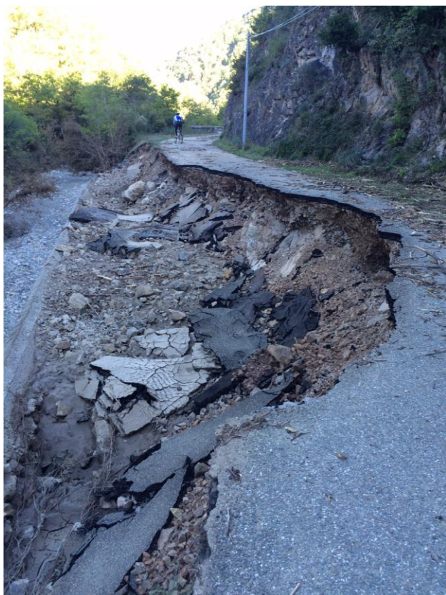
La route de Serviès

passage de véhicules. Olivier MELAC nous tiendra informé des avancées des travaux de réfection pour les prochaines sessions de chasse à l'approche. Il y a encore des risques d'éboulement. Deux photos pour vous donner une idée des dégâts :