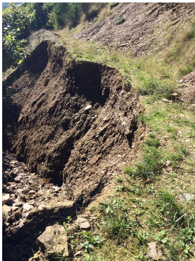
La piste de la Fialisse (circuit n° 6)

Ces deux sessions annulées sont reportées aux dates suivantes : celle du 25/09 au 09/10 et celle du 02/10 au 23/10, si les pistes sont réparées d'ici-là. La matinée du BGG est maintenue au 16/10. La matinée des formateurs est fixée au 30/10.