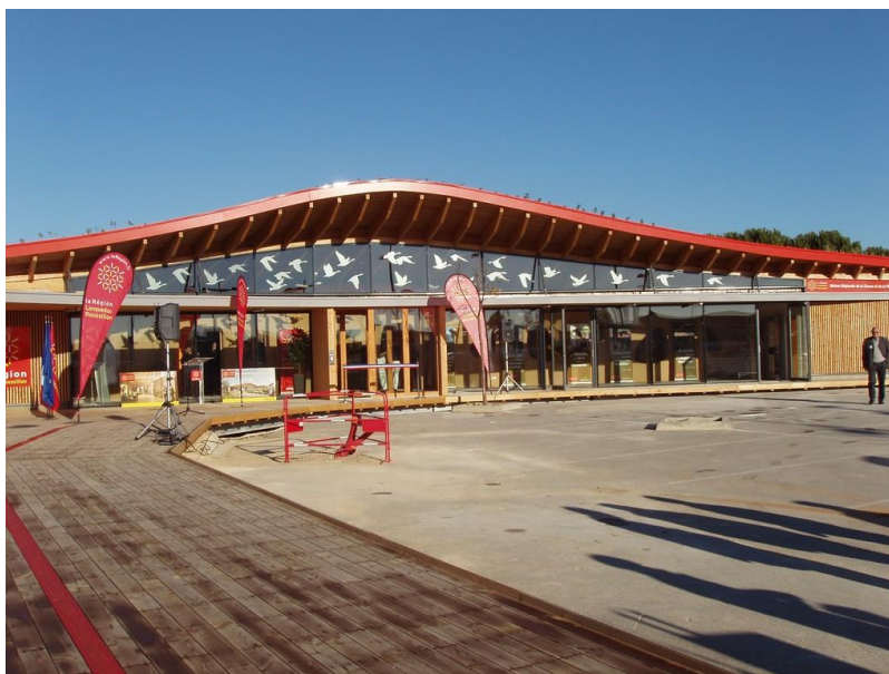
Vue de la Maison Régionale de la Chasse et de la Pêche.