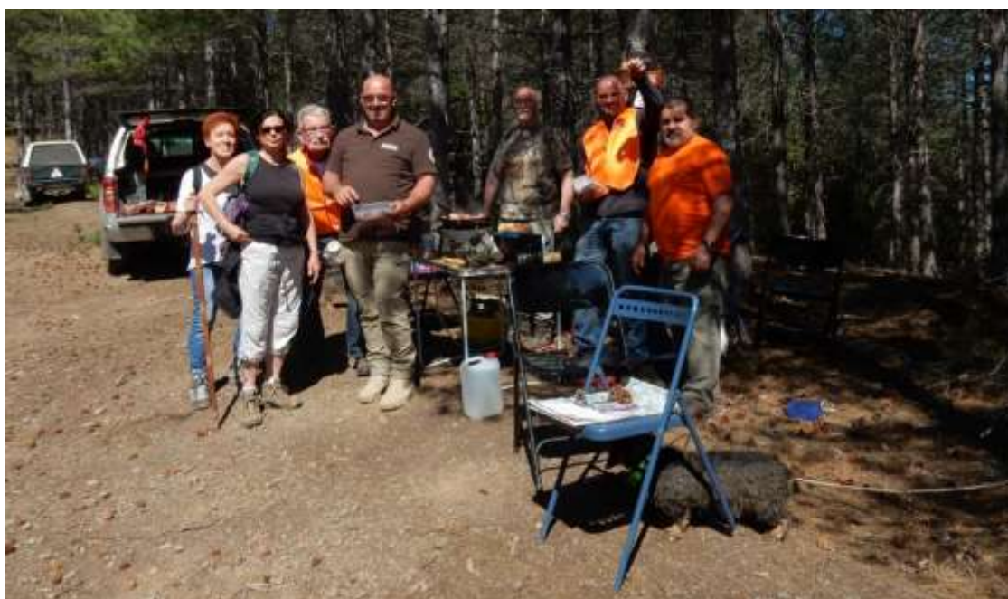
Parmi d'autres, l'atelier de la recherche au sang.

Le balisage des circuits, les emplacements des ateliers et le montage des stands ont été réalisés le samedi après-midi par les randonneurs, des membres de l'ADCGG34 et les chasseurs locaux. Le rallye a débuté le dimanche matin à 08h00. Il a réuni environ 250 participants et s'est déroulé sur un circuit de 15 km sur lequel se trouvaient 13 ateliers. Chaque atelier était tenu par deux membres de l'ADCGG, un ou deux membres du CDRPH et un chasseur local. Ils traitaient de la lecture de carte, du grand gibier, de l'équipement, de la sécurité du tir, des traces, des chiens de recherche au sang, de la sylviculture, du petit gibier, des trophées, du GPS, du stand de la Chasse au féminin, de la chasse à l'arc, et du stand des Jeunes chasseurs.