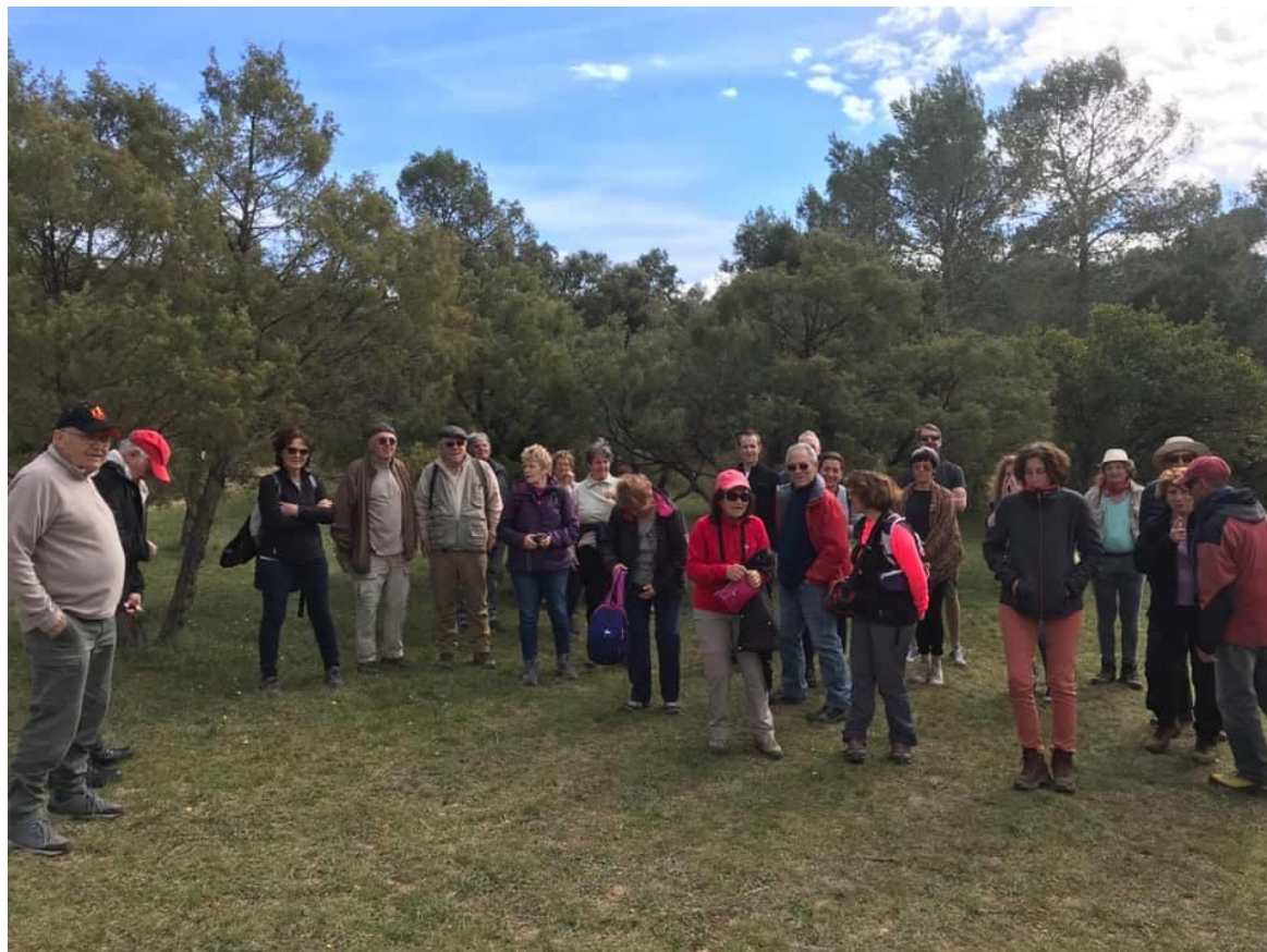
Une partie des participants

Ce samedi a eu lieu la battue photographique organisée par l'AD et la Diane des Hauts de Boscorre d'Argelliers. Cinquante personnes postées... un temps agréable... des fermes de qualité... huit sangliers et deux chevreuils ont été vus sur les lignes... tous, bien sûr n'ont pu être photographiés. De l'avis des participants, cette manifestation a été une réussite et certains se sont déjà inscrits pour l'année prochaine ! Ce rapprochement du monde de la chasse et des non-chasseurs a été apprécié de part et d'autre. Un pari réussi ! C'était une volonté de porter ce projet, malgré l'indifférence ou l'opposition de certains partenaires officiels à la mise en place de ces rencontres. Merci à tous les organisateurs, piqueurs et participants !