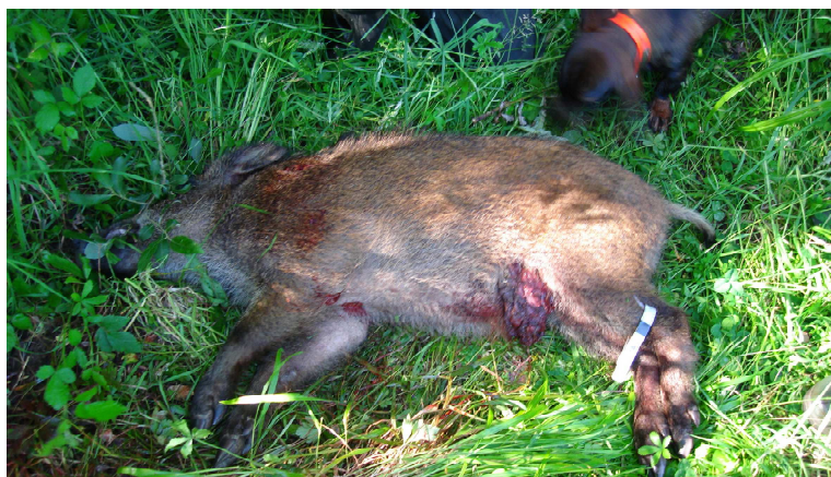
Tir d'affût carabine. Blessure abdomen. Animal retrouvé vivant et achevé.

Lorsque la recherche est réussie, la FDC35 vous rembourse le prix du bracelet (ou une partie) la saison suivante.