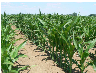
Céréales à paille, maïs, colza, tournesol: De 70 à 80 % des dégâts...

tenir la commission départementale. Le prix final des denrées est donc fixé département par département, mais... dans une fourchette nationale.