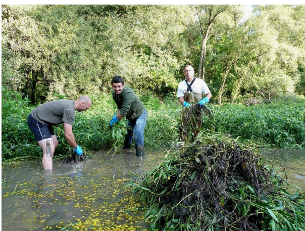
Notre Président en plein effort d'arrachage de jussie, en compagnie de deux administrateurs du CABS.