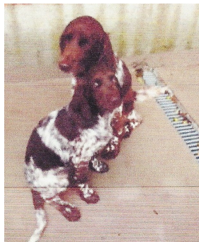
Jocker et Jack « Des Terriers de la Sauldraie »

(41) A vendre, 2 chiots mâles « PETITS MUNSTERLANDERS » L.O.F. nés le 3 mai 2014. Pucés, vaccinés, élevés en famille, parents chasseurs, Pris 650 €, facilités de paiement TEL 06 82 14 13 34