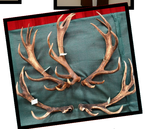
Quelques mueses solognotes...