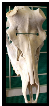
Un cerf mulet ...