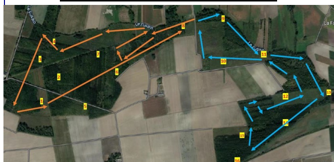
Plan d'une traque-affût,.... En jaune et bleu , les 2 circuits des rabatteurs;

Pour contacter Florian GASPARDINI 06 72 45 66 97 floriangasparini@hotmail.com